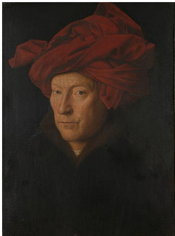
Jan van Eyck, Portret mężczyzny w czerwonym turbanie (przypuszczalny autoportret artysty), 1433