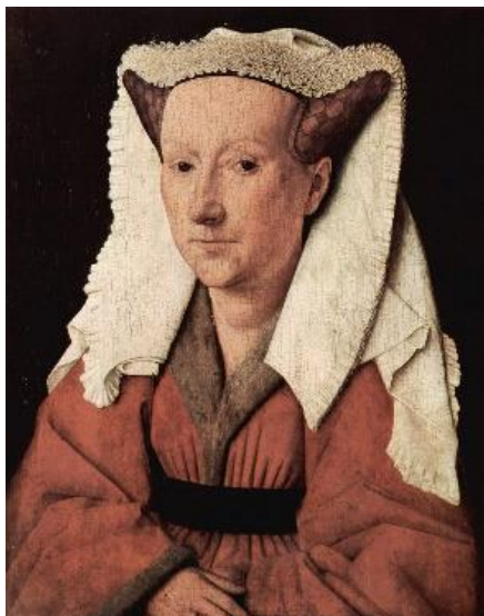
Jan van Eyck, Portret Małgorzaty van Eyck, 1439

a w drodze powrotnej dwory włoskie: Genuę, Florencję, Padwę i Wenecję. Około 1431 ożenił się, kupił dom w Brugii i tam prawdopodobnie zorganizował swoją pracownię.