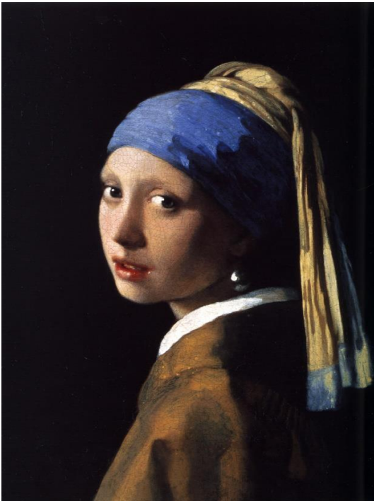
Johannes Vermeer, Dziewczyna z perłą , ok. 1664, olej na płótnie, 44,5x39cm